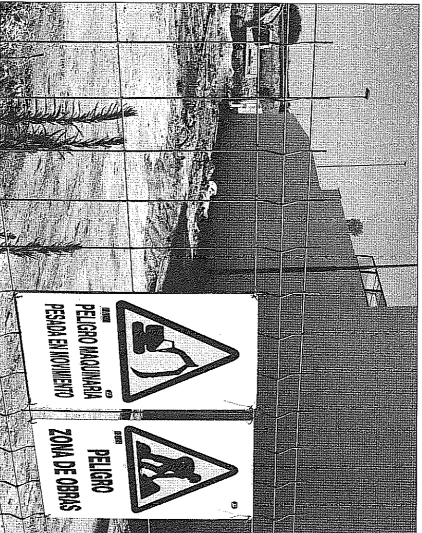
SINIESTRO. Obra en la que trabajaba el hombre de 30 años que murió ayer sepultado en Huelva.